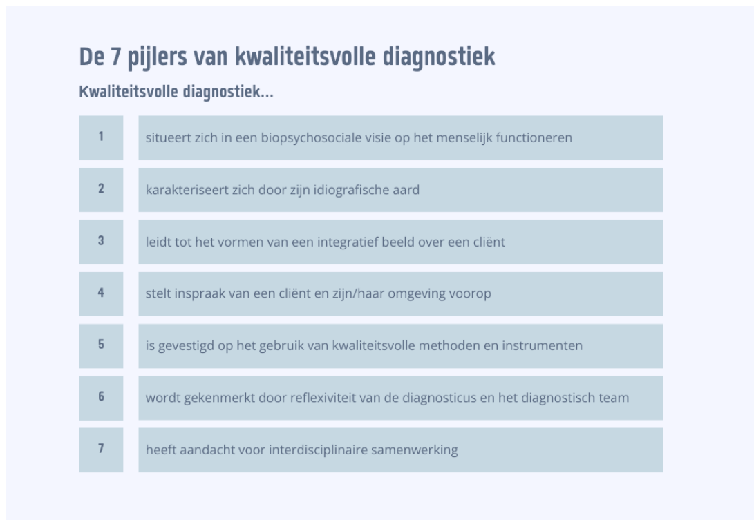
Figuur 1.1. De zeven pijlers van kwaliteitsvolle diagnostiek

de hand van zeven pijlers , zoals sinds 2020 beschreven in de Algemene Intersectorale Richtlijn Diagnostiek (AIRD) .